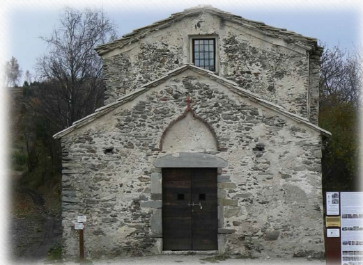
4. Від Віоли Кастелло до пагорба Сан-Джакомо