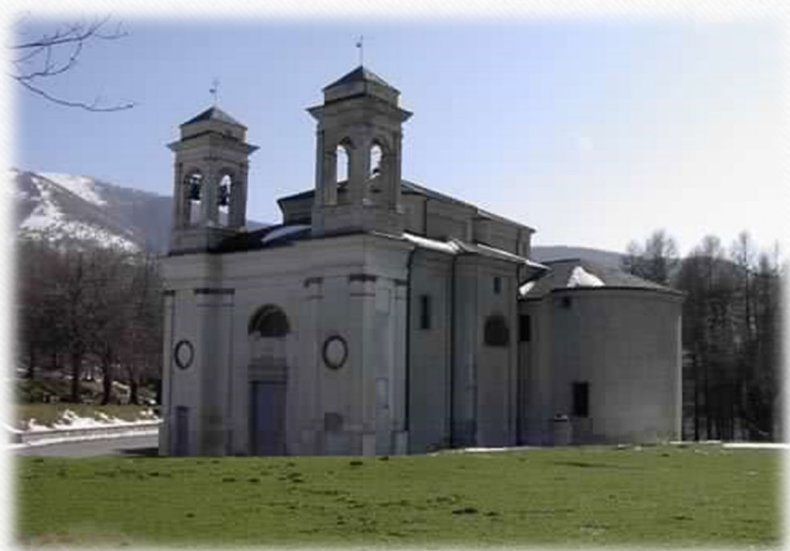
1. У святилищі Мадонна делла Неве