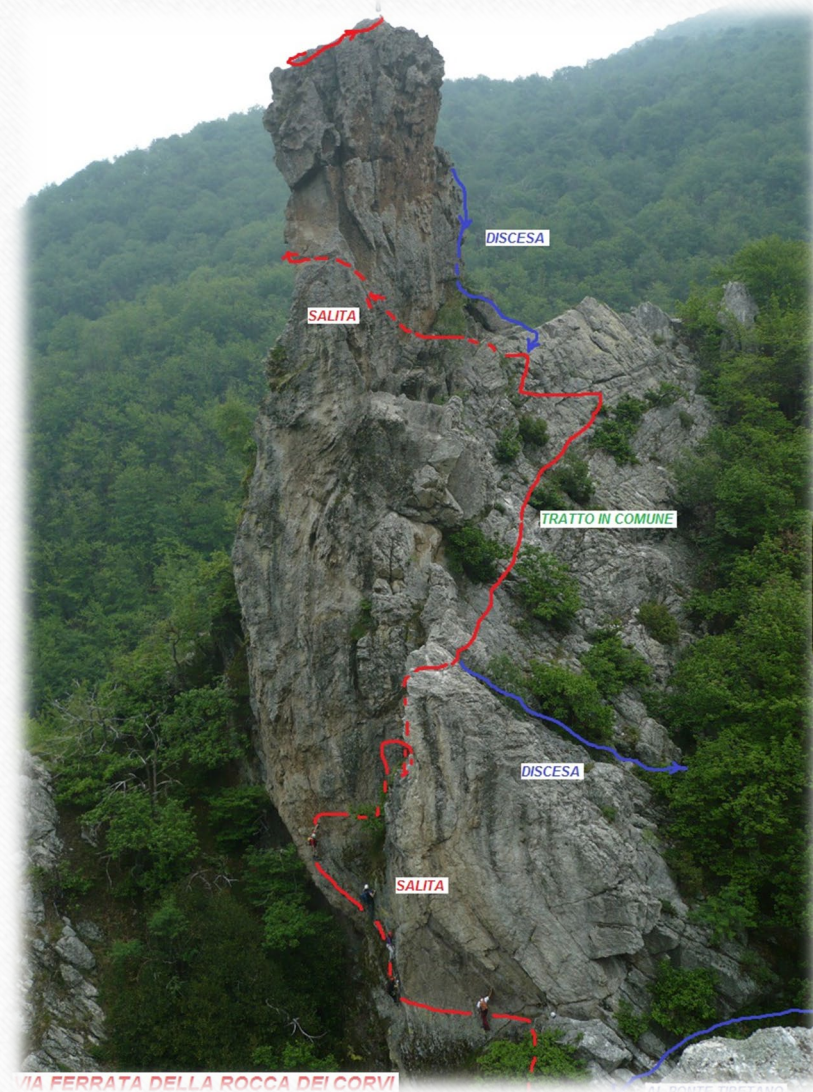
3. До «Сфінкса» або «Фортеці ворон»