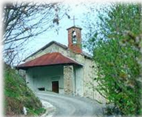
2. До каплиці Сан-Джованні