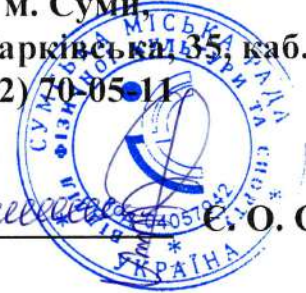
Є. О. Обравіт