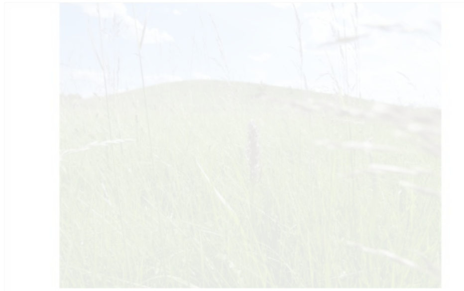
Рис. 2. Рослини Dactylorhiza incarnata у межах досліджуваної території у заплаві річки Хмелівка

L.), дивина борошніста ( Verbascum lychnitis L.), люцерна серповидна ( Medicago falcata L. aggr.), шавлія лучна ( Salvia pratensis L.), буквиця лікарська ( Betonica officinalis L.), гадючник звичайний ( Filipendula vulgaris Moench), дрік фарбувальний ( Genista tinctoria L.), чебрець повзучий ( Thymus serpyllum L.), сокирки польові ( Consolida regalis S.F. Gray ( C. arvensis Opiz)).