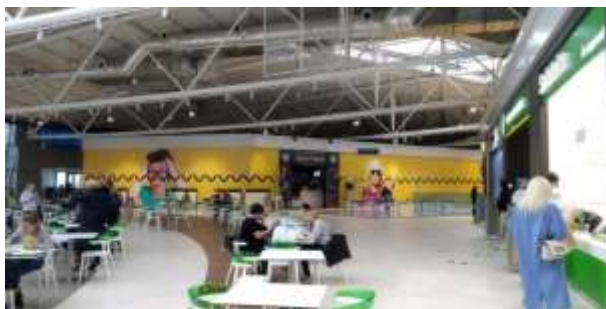
Рис. 1.11. ТРЦ «River Mall»: зона фудкорта

4. Зона фудкортів – знаходиться на третьому поверсі, велика за площею, прикрашена штучними рослинами, що розміщені біля диванів (рис. 1.11).