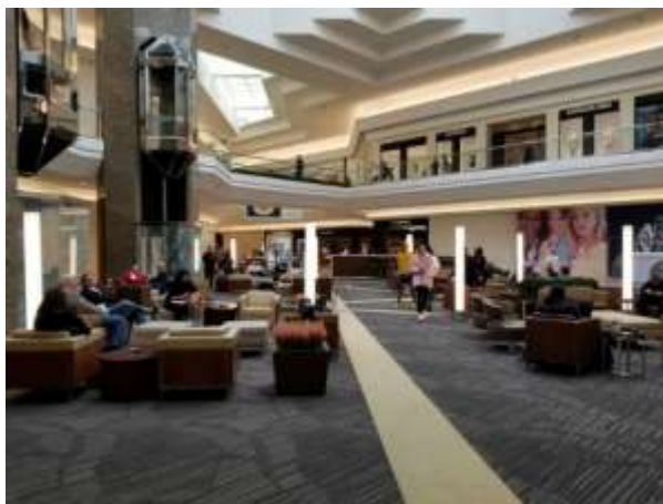
Рис. 2.1. ТРЦ Cherry Creek Center, Денвер, США [15]

фітодекорування інтер'єрів ТРЦ мають бути підпорядковані його основній концепції: наприклад, в зонах відпочинку та фудкортів доречними є невеликі клумби (рис. 2.1). Конструкції клумб можуть бути виготовлені з бетону, дерева, металу, особливо актуальною є клумба у вигляді лавки [15].