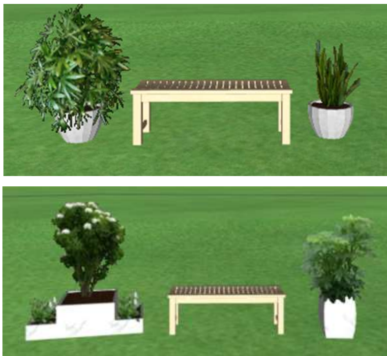
Рис. 3.3. Приклад озеленення зони відпочинку ТРЦ «River Mall»

– в зоні для відпочинку створити композиції з використанням гарденії жасминової ( Gardenia jasminoides L.) та спатіфілума Уолліса ( Spathiphyllum wallisii ), які поєднуюватимуться білим кольором квітів з інтер'єром (рис. 3.3);