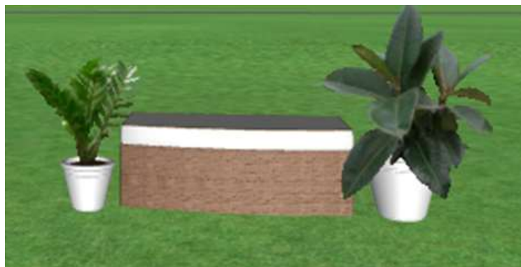
Рис. 3.1. Приклад озеленення зони відпочинку ТРЦ «Ocean Plaza»

– контейнерні рослини: фікус каучуконосний ( Ficus elastica L.) та заміскулькас замієлистий ( Zamioculcas zamiifolia L.), які є не вибагливими до умов навколишнього середовища та чудово вписуються в інтер'єр зон для відпочинку відвідувачів (рис. 3.1);