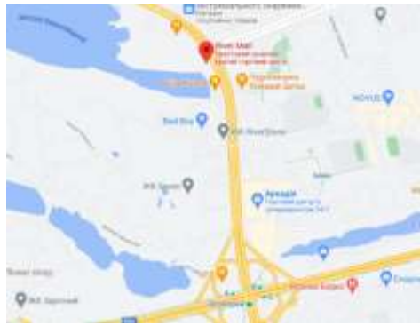
Рис. 1.8. Розміщення ТРЦ «River Mall» [12]

ТРЦ «River Mall» має 4 торгових поверхи та багаторівневий паркінг на 1550 машиномісць, обрамлений зовні синіми блоками, що нагадує за стилем фасад ТРЦ «Ocean Plaza». ТРЦ «River Mall» поділений на 4 зони: