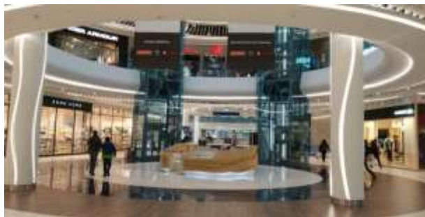
Рис. 1.9. Вхідна зона ТРЦ «River Mall»

1. Вхідна зона – просторий хол – із ресепшн адміністратора ТРЦ, де можна дізнатися потрібну інформацію. Інтер'єр підкреслюють білі колони з неонову підсвіткою, якою оформлений весь торговий центр (рис. 1.9).