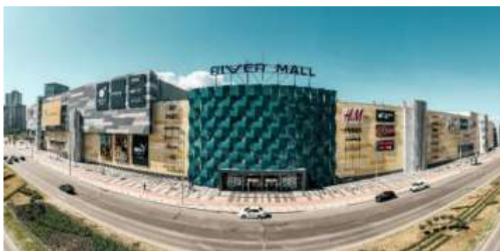
Рис. 1.7. Центральний вхід ТРЦ «River Mall» [13]

В ТРЦ «River Mall» також знаходяться 16 ультрасучасних магазинів одягу для занять спортом і активного відпочинку – All Star, Adidas, Nike, Puma, Under Armour та інші. Основним орендатором є супермаркеті Сільпо [13].