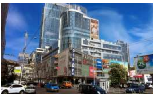
Рис. 1.12. Вигляд ТРЦ Gulliver [19]

У ТРЦ «Gulliver» функціонують близько 20 закладів з різноманітною кухнею: від традиційної української до вишукані італійської та японської, серед яких відомі ресторани Mr.Zuma, Merkato та RAY (рис. 1.12). Для зручності відвідувачів у комплексі цілодобово функціонує критий паркінг на 450 машиномісць і паркінг біля ТРЦ [14].