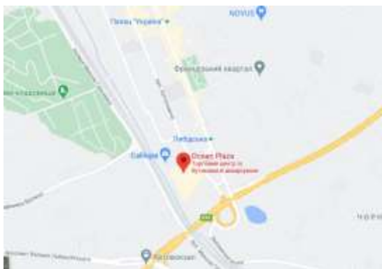
Рис 1.3. Розміщення ТРЦ «Ocean Plaza» [12]

Деміївська та Палац Україна. Відвідувачі, які пересуваються власним автотранспортом, також зручно зможуть дістатися до ТРЦ, адже він розташований біля автомагістралі. В радіусі 5 км збудовані такі ЖК: «Центральний парк», « Французький квартал», «The lakes», «Престиж Холл», «Бульвар фонтанів», «A136 Highlight Tower» та «West House» (рис. 1.3).