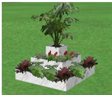
Рис. 3.5. Приклад озеленення зони пасивного відпочинку

– встановити «гігантську» модульну конструкцію з живих рослин та відмежувати нею зони кафе від частини проходу;