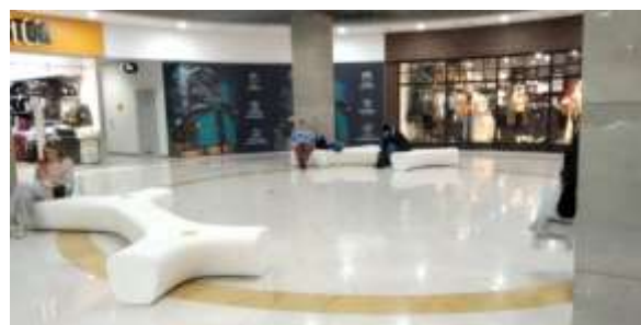
Рис. 1.15. ТРЦ «Gulliver»: місця для пасивного відпочинку

3. Розважальна зона представлена дитячим розважальним центром, кінотеатром та фітнес центром.