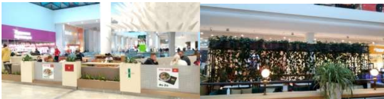
Рис. 1.6. Зона біля фудкортів ТРЦ «Ocean Plaza»

4. Зона кафе та ресторанів, знаходиться на першому поверсі і зона фудкортів – на другому. Ресторани і кафе декоровано живими рослинами: хлорофітум чубатий ( Chlorophytum comosum L. ), епіпремнум золотистий ( Epipremnum aureum L. ), сансев'єрія трисмугова ( Dracaena trifasciata L. ) та спатифілум Волліса ( Spathiphyllum wallisii L. ). Це надає свіжості та привабливості інтер'єру, збільшуючи тим самим кількість відвідувачів (рис.1.6).