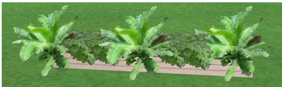
Рис. 3.2. Приклад озеленення вхідної зони ТРЦ «Ocean Plaza»

– для збільшення кількості відвідувачів пропонується створити фотозону, прикрасою якої стане «струнний сад» з кокедамами, земляними кулями, огорнутими в мох, в яких ростуть декоративні рослини [20].