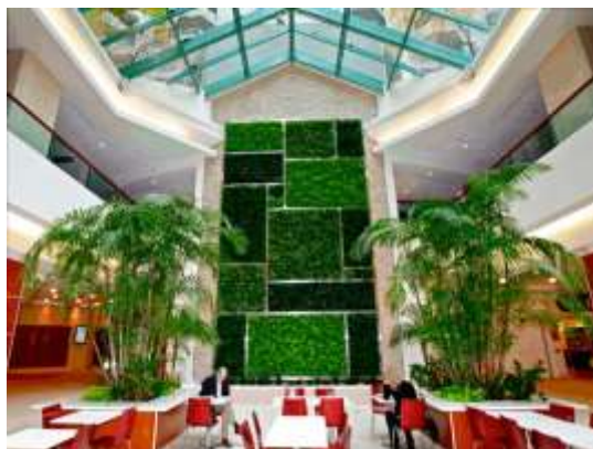
Рис. 2.4. Приклад озеленення кафе в ТРЦ [17]

В зонах розташування кафе та фудкортів доречним є використання живих рослин, що сприяє зниженню рівня стресу і втоми, сприяє єднанню людини з природою (рис. 2.4).