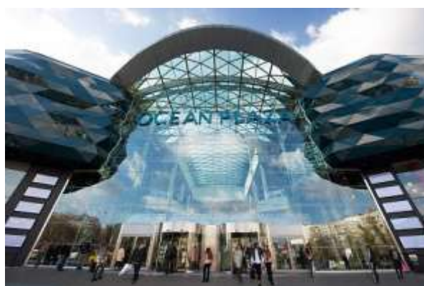
Рис. 1.2. Центральний вхід в ТРЦ «Ocean Plaza» [11]

ТРЦ «Ocean Plaza» містить публічний акваріум об'ємом 350 тис. літрів, кінокомплекс «Сінема Сіті Київ» (площею 4239 м 2 ), а також паркінг на 1407 місць (площею 60 тис. м 2 ). Відвідуваність ТРЦ «Ocean Plaza» за 2019 рік склала 19,8 млн. покупців, що на 3,3 % менше, порівняно з 2018 р. Основним магазином-якорем є Ашан (рис. 1.2).