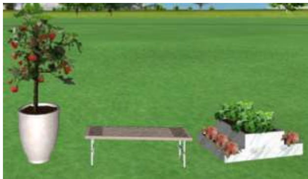
Рис. 3.4. Приклад озеленення зони відпочинку ТРЦ «Gulliver»

– збільшити кількість контейнерних рослин в зонах відпочинку з використанням червоних тонів (рис. 3.4., 3.5);