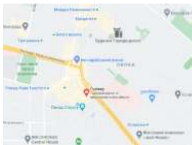
Рис. 1.13. Розміщення ТРЦ «Gulliver» [12]

ТРЦ «Gulliver» знаходиться за адресою Спортивна площа, 1а в пішій доступності до станцій метрополітену Палац спорту, Площа Льва Толстого, Кловська. Поряд розташовані Бессарабський ринок, Палац спорту. Найближчі ЖК «CHICAGO», «Central House», «Jack House» ЖК «Тетріс Холл» (рис. 1.13).