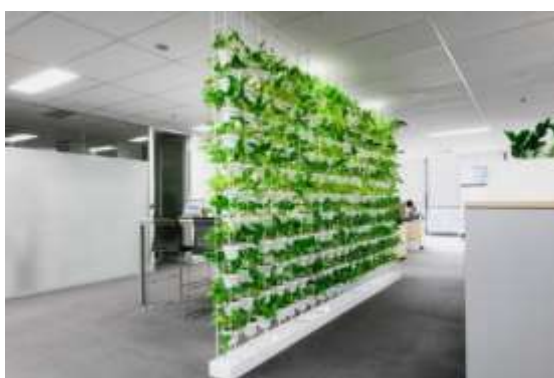
Рис. 2.2. Приклад вертикального зонування [16]

Особливої популярності набуває використання вертикального озеленення в інтер'єрі (рис. 2.2). «Зелена» стіна з рослин створює ефект бурхливої рослинності, за допомогою якою можливо зонувати територію, не займаючи лишньої частини площ [16].