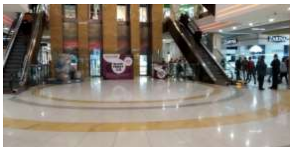
Рис. 1.14. ТРЦ «Gulliver»: зона входу

1. Вхідна зона – містить великий хол та засоби зручного пересування на інші поверхи (рис. 1.14).