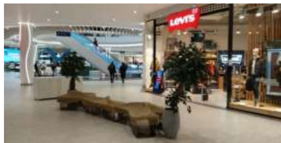
Рис. 1.10. ТРЦ «River Mall»: зони для відпочинку

2. Торгівельна зона – знаходиться на 1,2 та 3-му етажах. Для зручності відвідувачів по всьому ТРЦ розташовані острівці для відпочинку. Декоровані вони горщиками зі штучними квітами (рис.1.10).