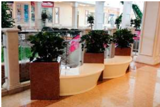
Рис. 2.3. Приклад контейнерного озеленення ТРЦ [17]

Популярним різновидом фітодизайну інтер'єрів ТРЦ є контейнерне озеленення, коли за допомогою підбору кольорів, матеріалів і фактур єдностей для рослин можна створити неповторний вигляд озеленого простору (рис. 2.3).