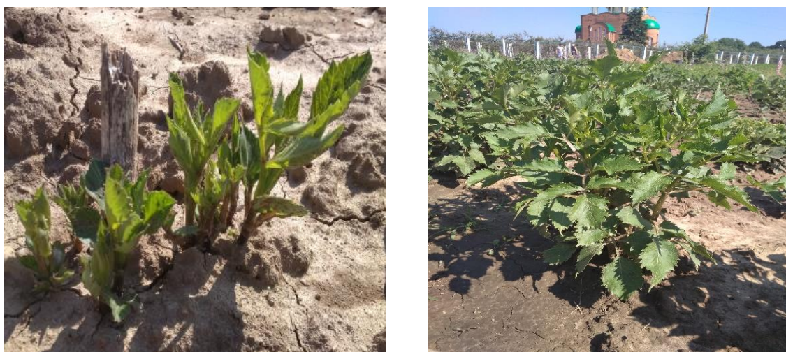
Рис.9. Сходи та розвиток сорту « Jeanne d'arc »

« Jeanne d'arc » – сорт рожевого кольору. Листя прості, попарно сидячі. Стебла прямі, гіллясті, гладкі або шорсткі, порожнисті, до 250 см заввишки. Листя перисті, іноді двічі або тричі перисті, рідше цілісні, 10-40 см завдовжки, різного ступеня опушенности, зелені або пурпурові, розташовані супротивно. Місце розташування: сонячні, захищені від холодних і сильних вітрів місця з хорошою циркуляцією повітря. Не можна висаджувати їх на низьких і заболочених ділянках. Ділянка, підібрана для жоржин, повинна освітлюватися вдень принаймні шість годин [28].