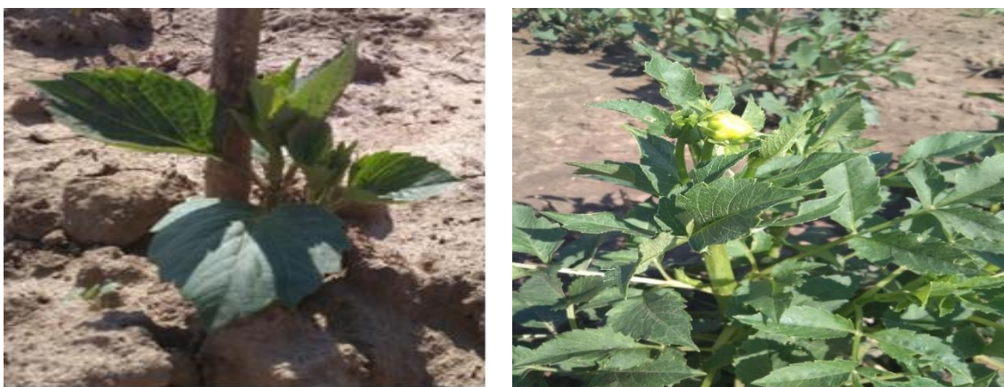
Рис. 10. Сходи та розвиток сорту « Red Majorette »

Сорт « Red Majorette » червоного кольору і належить до напівкактусових жоржин. Висота куща до 100 см, напіврозгалужений, потребує в майбутньому опори.