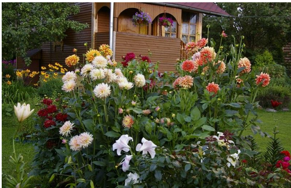
Рис. 2. Квітково-декоративна композиція з використанням жоржини культурної ( Dahlia cultorum Cav.)

Для всіх країн з суворими зимами, жоржини є виключно сезонними рослинами. Вони не зимують у відкритому ґрунті та потребують щорічного збереження після викопування з ґрунту. Але це не обмежує сферу їх використання. Різноманітність жоржин дозволяє вводити їх практично в будь-які квітково-декоративні композиції (Рис. 2) [59].