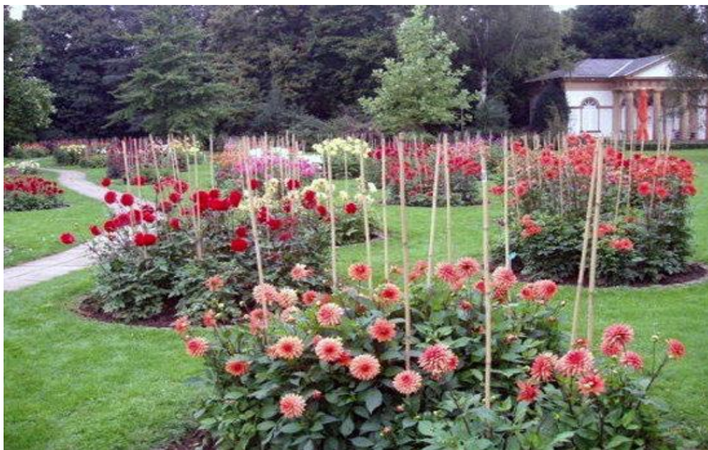
Рис. 4. Жоржина культурна ( Dahlia cultorum Cav.) в поєднанні з газоном

У групових посадках представляють великий інтерес жоржини з темним забарвленням листя. Особливо цінні серед них – сорти з декоративним листям червонувато-вишневого, червонувато-коричневого або жовто-бронзового відтінку. Яскраве забарвлення суцвіть, виражена, в основному, темно- і яскраво-помаранчевими і вишнево-червоними тонами, доповнює їх декоративність. Темнолистові жоржини застосовують для створення темних плям або бордюрів на клумбах і рабатках з високими квітами. Ці жоржини часто, так само як і карликові, розмножують насінням і культивують як однорічники [23, 59].