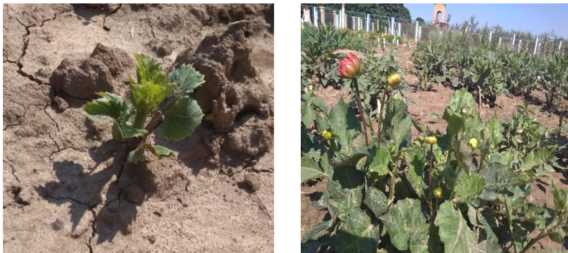
Рис. 8. Сходи та розвиток сорту « Franz Kafka »

« Jeanne d'arc » – сорт рожевого кольору. Листя прості, попарно сидячі. Стебла прямі, гіллясті, гладкі або шорсткі, порожнисті, до 250 см заввишки. Листя перисті, іноді двічі або тричі перисті, рідше цілісні, 10-40 см завдовжки, різного ступеня опушенности, зелені або пурпурові, розташовані супротивно. Місце розташування: сонячні, захищені від холодних і сильних вітрів місця з хорошою циркуляцією повітря. Не можна висаджувати їх на низьких і заболочених ділянках. Ділянка, підібрана для жоржин, повинна освітлюватися вдень принаймні шість годин [28].