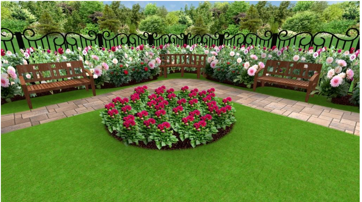
Рис.14. Міксбордер із використанням досліджуваних жоржин

Жоржини широко застосовують у квітниковому оформленні садів парків, скверів, майданів та інших громадських місць. Особливо ефектними є крупноквіткові жоржини у змішаних посадках, а саме вздовж основних доріжок і груп кущів.