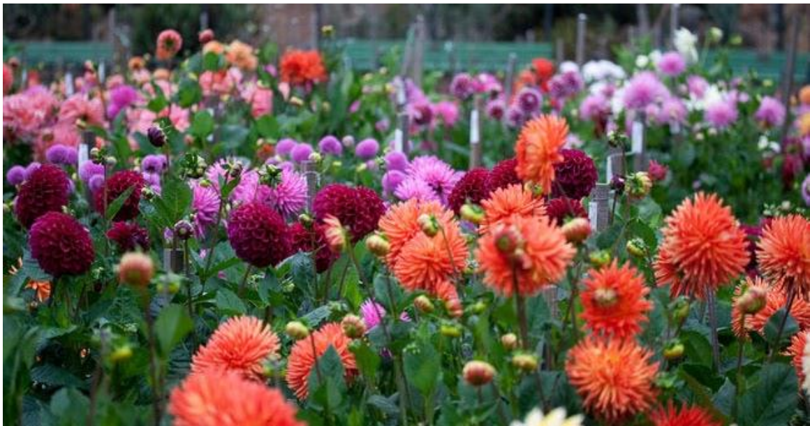
Рис. 5. Масив з жоржини культурної ( Dahlia cultorum sav.)

Жоржинарії влаштовують на великих відкритих сонячних площах (або з рідкісними групами дерев і чагарників) порівняно рівних або терасного типу, зручного для огляду з різних сторін ( Рис. 5) [23].