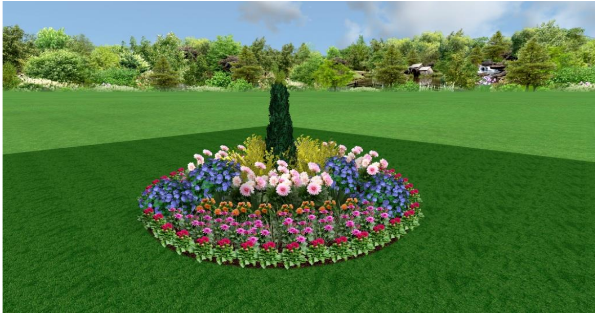
Рис. 12. Клумба з використанням досліджуваних жоржин

озелененні ділянок висвітлено недостатньо, тому є необхідність у подальшому вивченні цього питання.