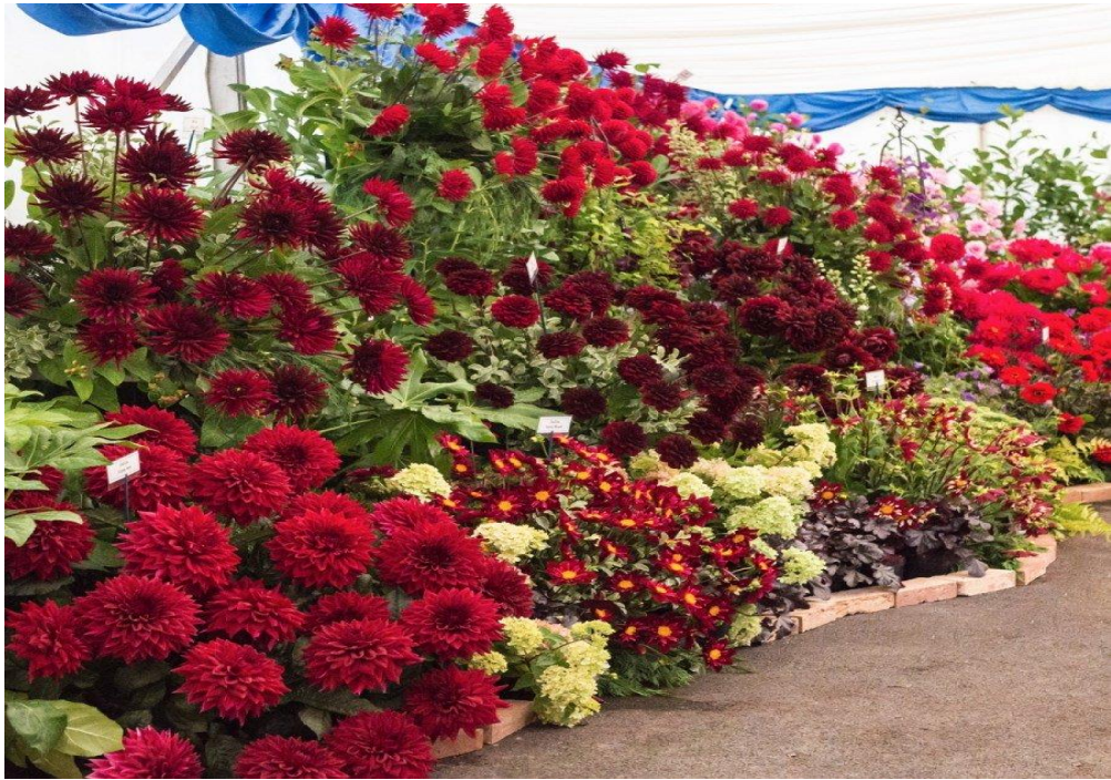
Рис. 3. Поєднання кольорової гами жоржини культурної ( Dahlia cultorum Cav.) з іншими квітково-декоративними видами

Стилістичних обмежень для використання жоржин немає. Вони підходять для стилю кантрі, романтики, регулярних течій, сучасних напрямків та навіть модерну. Необхідність ретельно прораховувати колірну гаму ансамблів – є єдиним обмеженням. Жоржини гарно виглядають при підборі гармонійного поєднання кольору (Рис. 3).