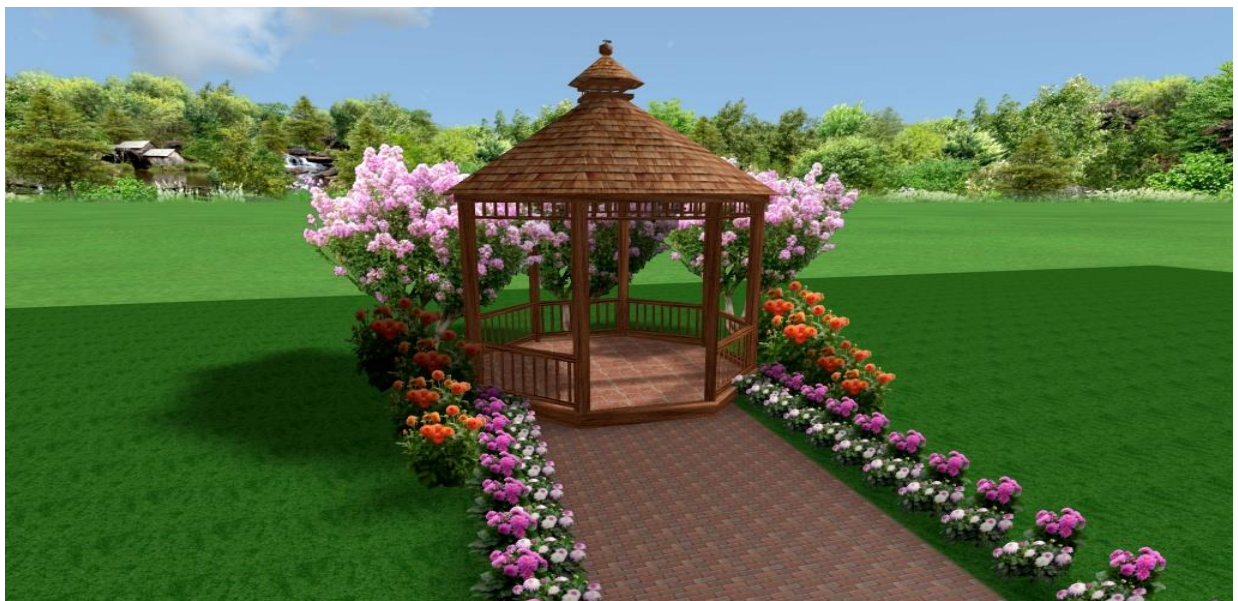
Рис.13. Використання досліджуваних жоржини у поєднанні з МАФ

Хвойник: туя західна ( Thuja occidentalis ); Кущі: Форзиція ( Forsythia ) та гортензія садова ( Hidrangea ); Сорти жоржини: « Jeanne d'arc », « Bonne esprit », « Arabian night », « Red Majorette ».