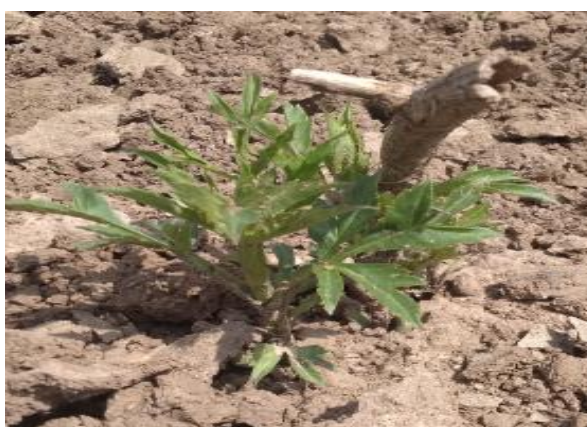
Рис.11. Сходи сорту « New dimension »

Напівкактусова жоржина сорту « New dimension ». Висота рослини – 70 - 80 см. Сорт розквітає великими щільними квітами рожевого кольору. Квіти сорту мають рожеве забарвлення, досягали у діаметрі 17 см. Цвіте рослина в період: липень-жовтень. За період проведення досліджень тривалість цвітіння становила 92 доби. Висота куща становила 75 см.