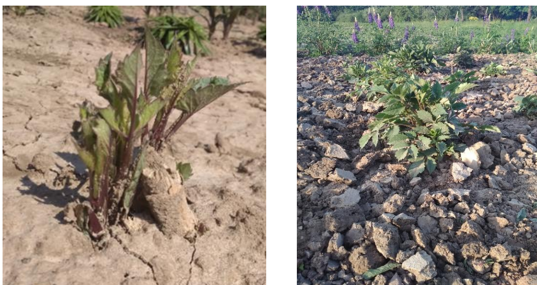
Рис. 7 Сходи та розвиток сорту « Arabian Night »

« Arabian Night » – сорт розкішного насичено вишневого забарвлення, шикарного та бархатистого. Кущі ростуть високими, тому другий-третій план на клумбах підійде – до 100 см, відмінно виглядають у посадці групою по 3-4 саджанця; пік хвилі цвітіння – середина-кінець літа, трохи слабкіше – у вересні, а далі по погоді – бутони будуть з'являтися до заморозків. Рослини – теплолюбні, в півтіні квітки стоять довше, але на сонці – цвітіння буде рясним та пишним; жоржинам потрібен якісний свіжий та поживний ґрунт, потребують викопування на зиму.